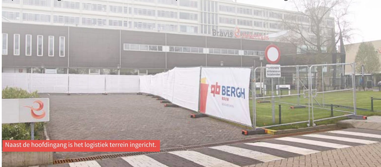
Naast de hoofdingang is het logistiek terrein ingericht.

Het logistiek terrein is afgezet met bouwhekken. Aan de hekken worden doeken bevestigd met artist impressions die goed laten zien hoe de vernieuwde poliklinieken en de kliniek er uit gaan zien.